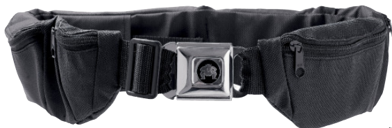
Bauchgurt mit sechs Kammern: der «BellyBelly».

Informationen und Bestellung: www.bellybelly.ch