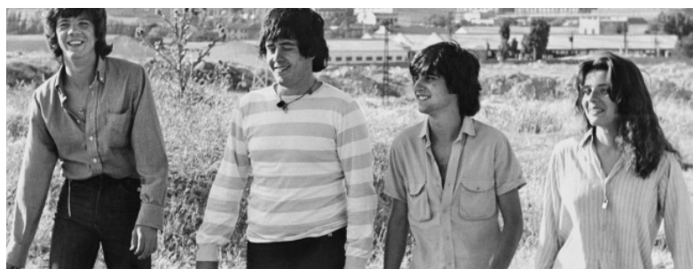
Szene aus dem Film «Deprisa, deprisa», den das heute Filmfoyer zeigt.

Winterthur: Anlässlich der vom Amt für Städtebau organisierten Veranstaltungsreihe «Baustelle Winterthur – Eine Stadtlandschaft im Wandel» greift das Filmfoyer das Thema «Stadt» auf und zeigt diesen Monat eine Auswahl von Filmen, in denen städtisches Leben thematisiert wird. Präsentiert wird ein bunt gemischtes Programm mit Streifen aus verschiedenen Genres, Ländern und Zeiten. Insbesondere weist das Filmfoyer auf den Spezialanlass vom Samstag, 5. September, im Güterschuppen des Bahnhofs Töss hin. red.